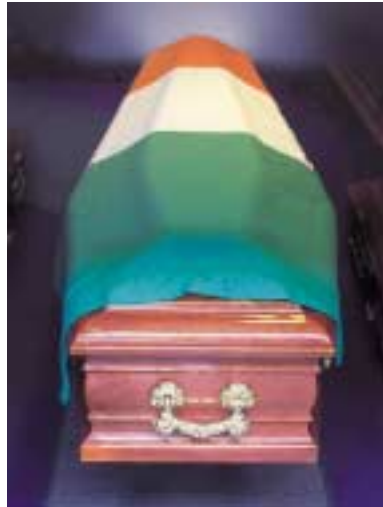
Head of coffin